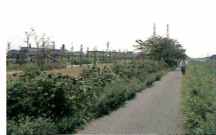
花見川サイクリングロード