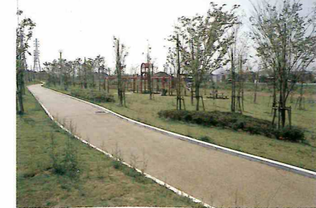
花見川沿いの緑地