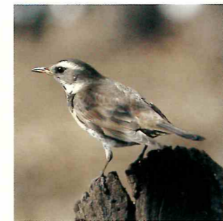
当地区に飛来する、つぐみ(左)としらさぎ(右)。

当地区の西側を流れる花見川は、魚釣りや野鳥観察が楽しめるスポット。川沿いに伸びるサイクリングロードを利用すれば、自転車で気軽に海へ出ることが出来ます。また、現在、花見川の岸辺に沿って緑と公園のネットワークづくりをめざす「花見川リバーサイド公園計画」が進行中。さらに当地区は都心や千葉市街へのアクセス条件もよく、また幕張新都心に近いこともあり、今後都市機能の向上が期待できるエリアでもあります。